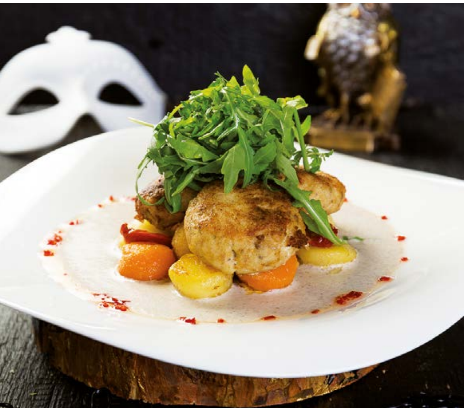
Котлетки из щуки и муксуна подаются с грибным капучино и листом салата