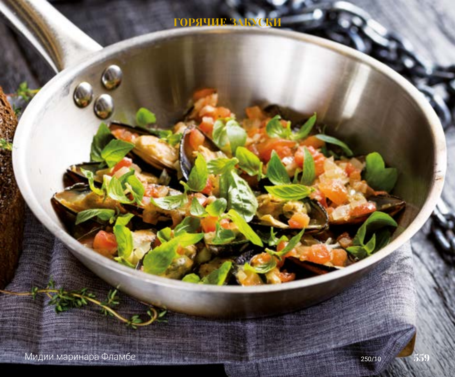
Мидии маринара Фламбе