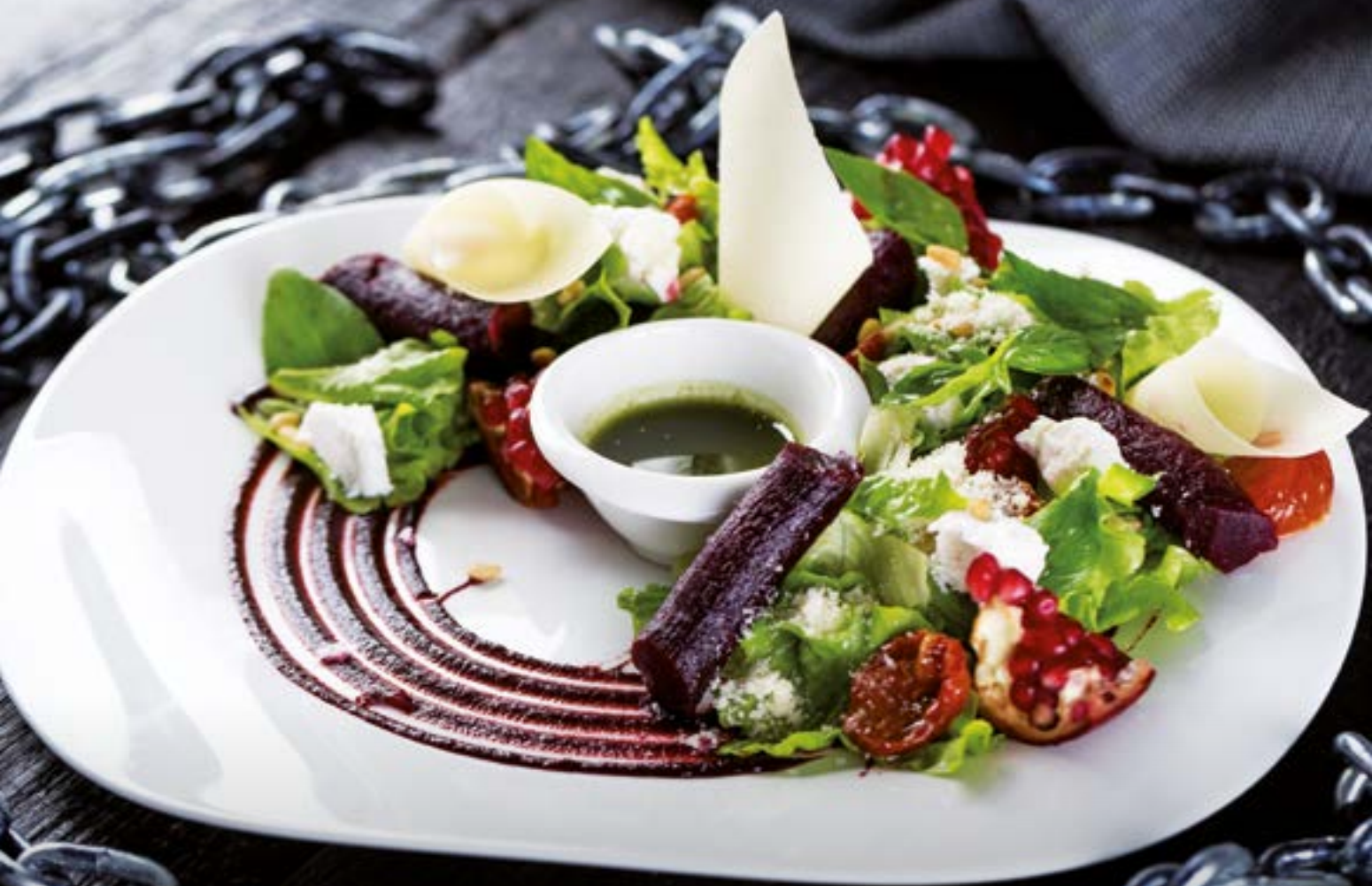
Свекольный салат a La Genovese